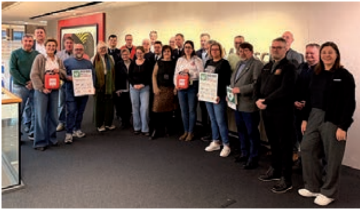
Die Vereinsvertreter freuen sich über je einen VRhilft-Defibrillator.